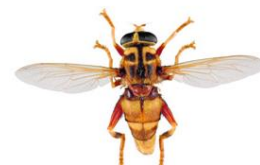
Moscas das flores, Milesia crabroniformis