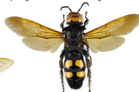
Vespa Mamute, Megascolia maculata