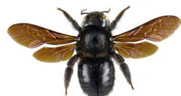
Abelha Carpinteira, Xylocopa violacea