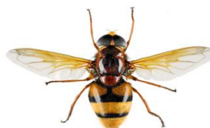
Moscas das flores, Volucella zonaria