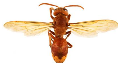
Vespa Oriental, Vespa orientalis