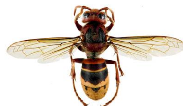
Vespa Europeia, Vespa crabro